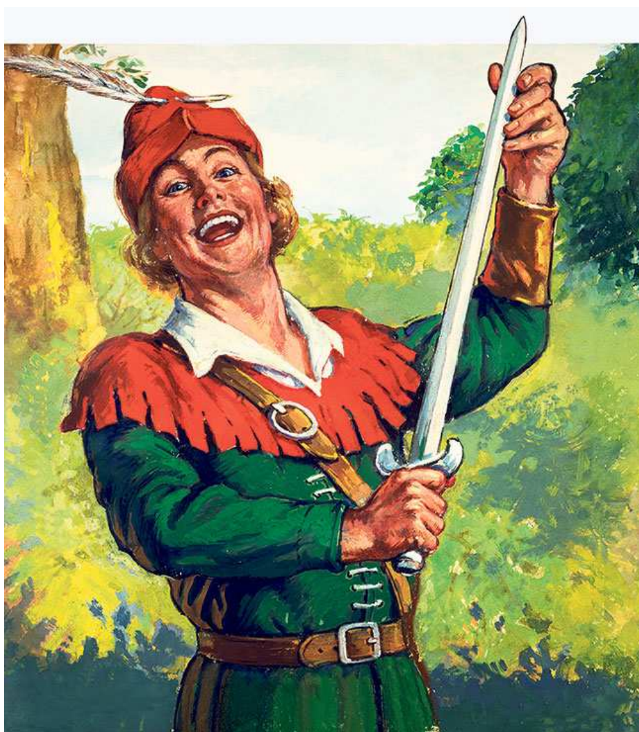
Anonyme. – « Robin des bois »