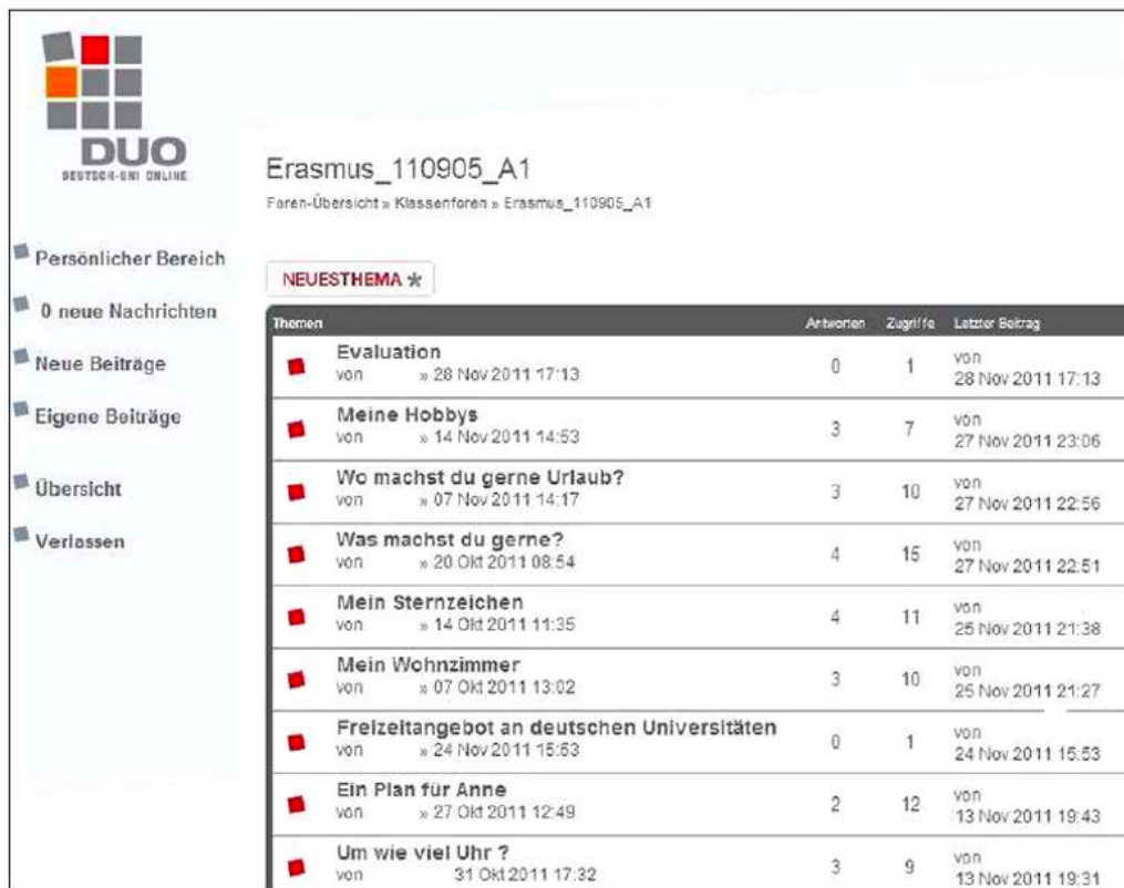
Abb. 1: DUO-Forum

Eine der Kommunikationsmöglichkeiten in DUO stellt das Forum dar. Abbildung 1 zeigt die Funktionen dieser asynchronen Kommunikationsform: