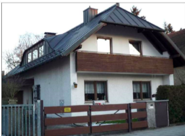
Abb. 2: Ein jordanisches und ein deutsches Haus

Umsetzung in der Praxis Welche Forumsaufgaben würden Sie auf der Grundlage der dargestellten Materialien vorschlagen? Konzipieren Sie 2-3 Aufgaben und bestimmen Sie ihre Ziele.