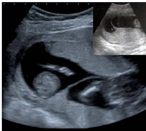
Figura 1. Segno lambda.

Il quadro ecografico nel I trimestre, preferibilmente dopo le 6 +7 settimane, quando è più semplice distinguere la membrana amniotica dal celoma extraembrionale, è caratterizzato da due differenti placente e da due differenti sacchi amniotici, ognuno delimitato da un proprio corion e da una propria membrana amniotica. Se le due placente sono totalmente separate, la diagnosi di corionicità è semplice, poiché si distinguono due distinti piatti placentari. Se invece le due placente sono conti-