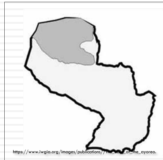
AYOREO TERRITORY IN PARAGUAY