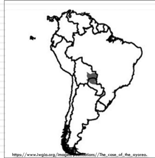
AYOREO TERRITORY IN SOUTH AMERICA