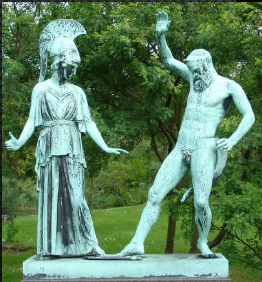
Figure isolate l'una rispetto all'altra ma in stretta connessione grazie alla complementarietà dei gesti e degli sguardi convergenti sul flauto abbandonato CONTRASTO non solo nelle posture instabili ma pannello dea vs corpo nudo e nervoso del sileno

Atena e Marsia sull'Acropoli di Atene → ricerca del contrasto