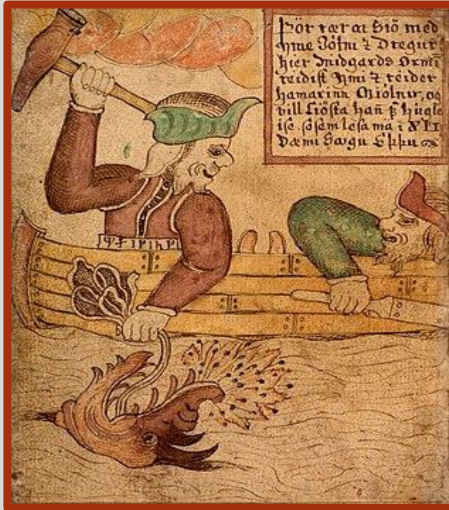
Thor e Hymir mentre affrontano il Miðgarðsormr

https://it.wikipedia.org/wiki/Mi%C3%B0gar%C3%B0sormr#/media/File:Thor_and_Hymir.jpg